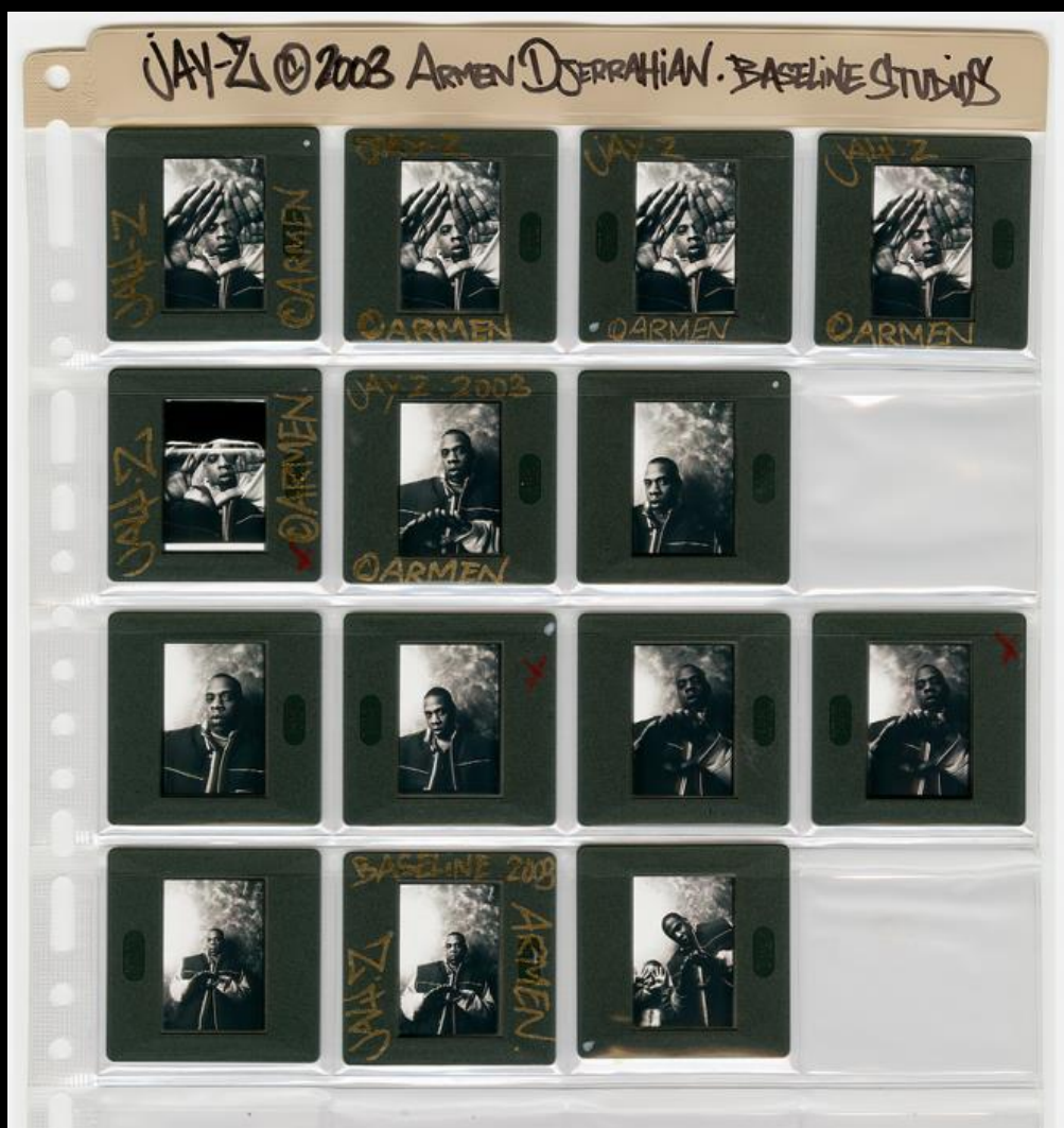
Jay-Z, 2003